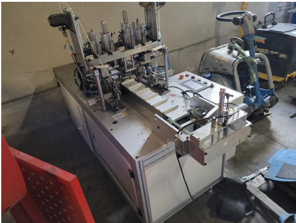
Fot. 5. Fot. tylny prawy narożnik