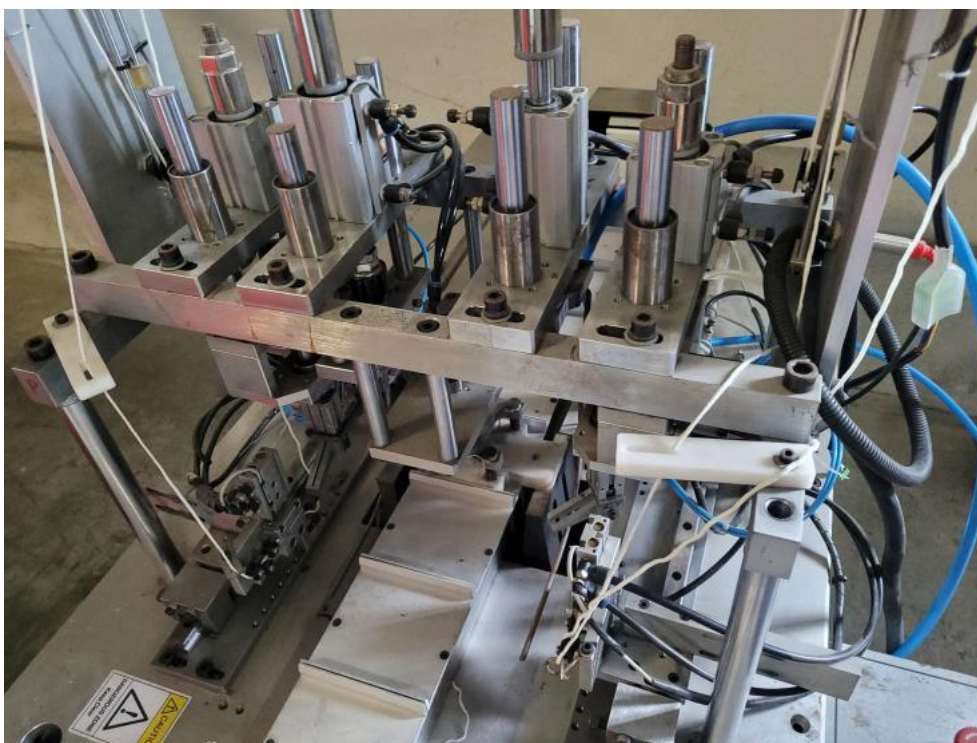
Fot. 13. Dokumentacja przedmiotu