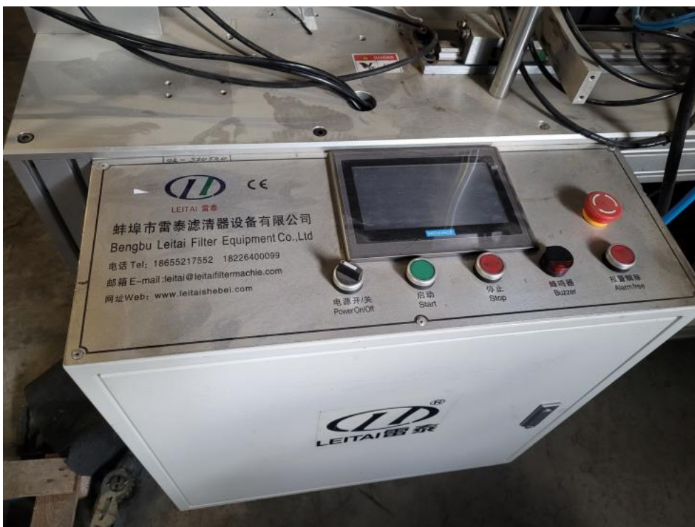
Fot. 10. Wskaźnik czasu pracy