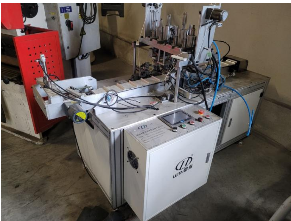
Fot. 3. Fot. przedni prawy narożnik