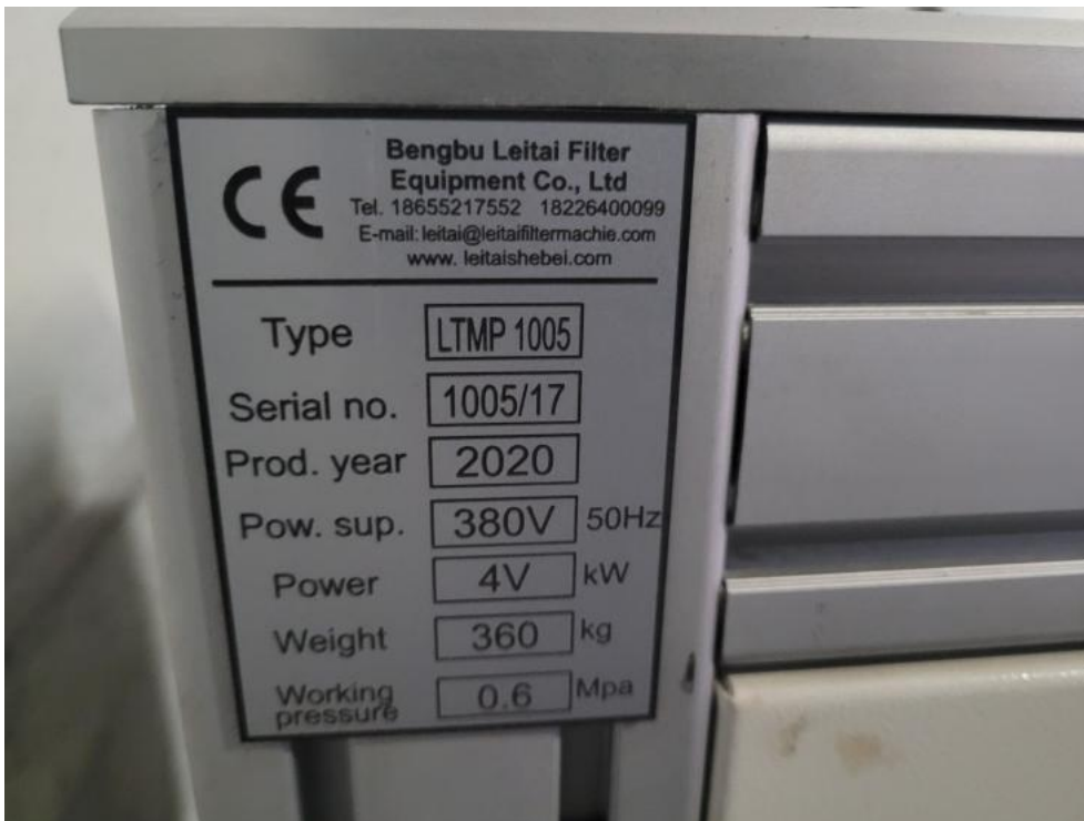
Fot. 9. Tabliczka znamionowa