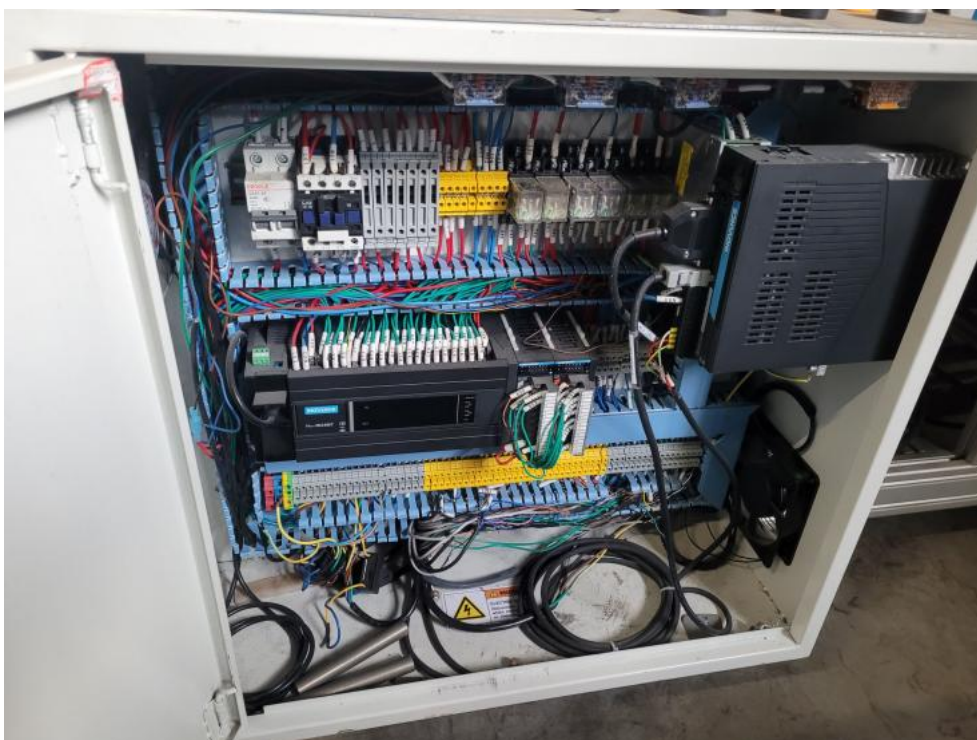
Fot. 12. Dokumentacja przedmiotu