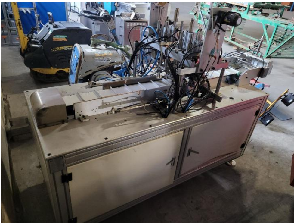
Fot. 7. Fot. tylny lewy narożnik