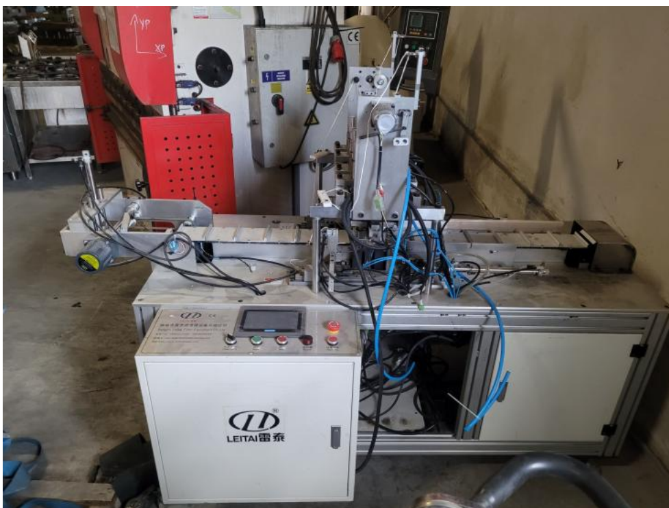
Fot. 2. Przód