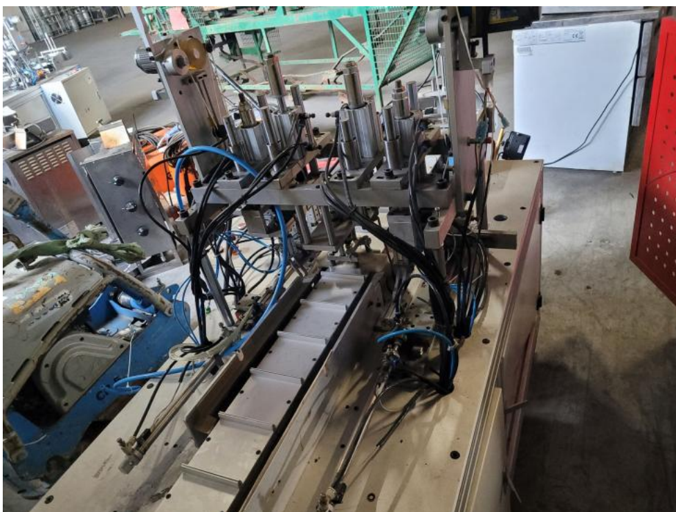
Fot. 8. Bok lewy