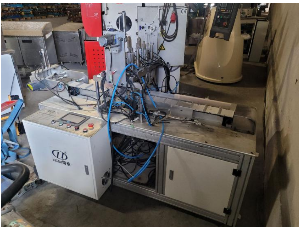
Fot. 1. Fot. przedni lewy narożnik