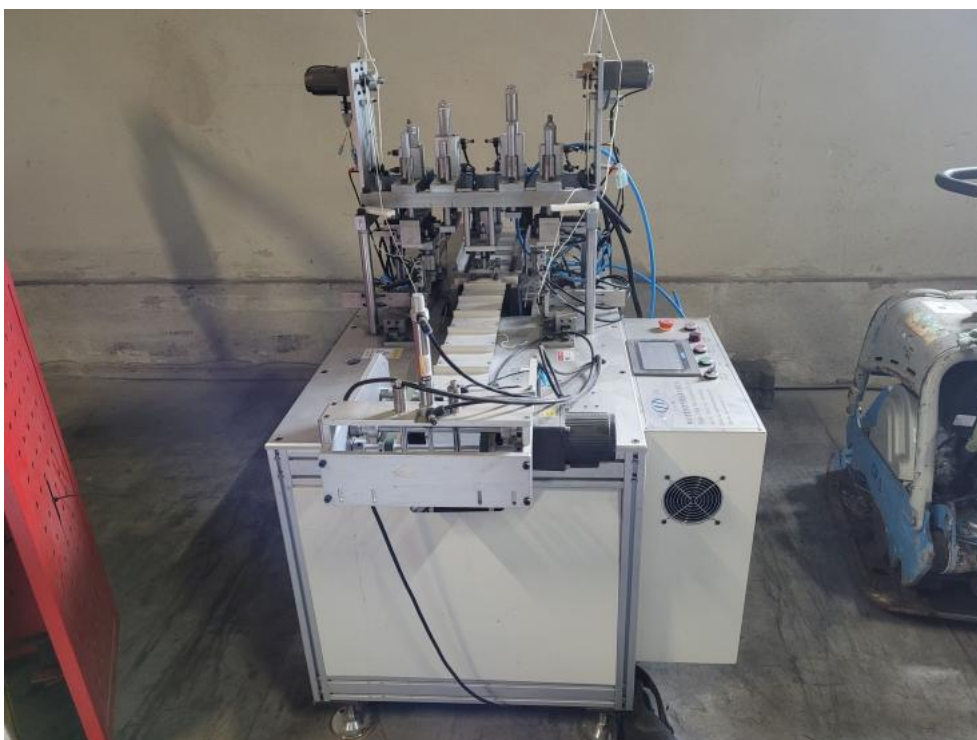
Fot. 4. Bok Prawy