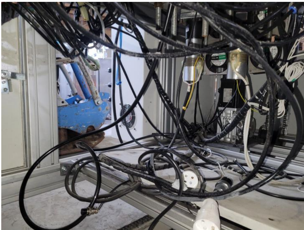
Fot. 11. Szczegóły